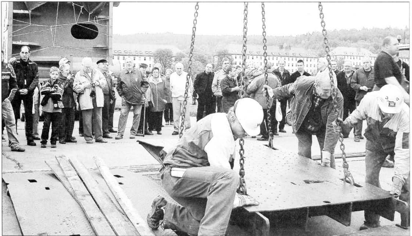
Premiere für die Zuschauer und für die Gimter Anlegestelle am ehemaligen Wasserübungsplatz der Bundeswehr: Arbeiter der holländischen Wassertransportfirma „Van der Wees“ fügen das letzte Teil der Rampe für die Verladung des Kolosses zusammen.